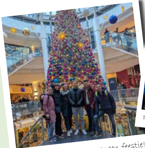
Düsseldorf: het was weer een feestje!

Schoolontbijt en drinkwatertappunt Sinds de herfstvakantie bieden we voor de leerlingen een schoolontbijt aan. Dit geldt, in principe, voor alle leerlingen. Leren gaat immers een stuk makkelijker met een volle maag. Ook is het lekker binnenkomen als je net een flink stuk naar school hebt gefietst met een warm kopje thee. Uiteraard is het schoolontbijt met name bedoeld voor leerlingen die niet de mogelijkheid hebben om thuis een ontbijt te kunnen nuttigen om wat voor redenen dan ook. Loop er dan ook zeker niet te hard voorbij, elke dag tussen 8:30 en 9:30 staat het schoolontbijt klaar bij het andere luik van de kantine. Om alle leerlingen en collega's te kunnen voorzien van een lekkere frisse slok water, is er dan ook nog een drinkwatertappunt geïnstalleerd. De tap is te vinden in de hal beneden, naast de betonnen trap. De ondernemende leerlingen van Economie & Ondernemen zijn al plannen aan het maken om hervulbare flessen in 't Winkeltje te gaan verkopen!