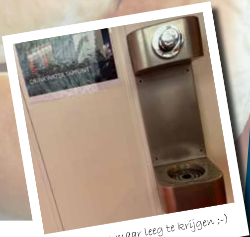
Probeer hem maar leeg te krijgen ;-)

Schoolontbijt en drinkwatertappunt Sinds de herfstvakantie bieden we voor de leerlingen een schoolontbijt aan. Dit geldt, in principe, voor alle leerlingen. Leren gaat immers een stuk makkelijker met een volle maag. Ook is het lekker binnenkomen als je net een flink stuk naar school hebt gefietst met een warm kopje thee. Uiteraard is het schoolontbijt met name bedoeld voor leerlingen die niet de mogelijkheid hebben om thuis een ontbijt te kunnen nuttigen om wat voor redenen dan ook. Loop er dan ook zeker niet te hard voorbij, elke dag tussen 8:30 en 9:30 staat het schoolontbijt klaar bij het andere luik van de kantine. Om alle leerlingen en collega's te kunnen voorzien van een lekkere frisse slok water, is er dan ook nog een drinkwatertappunt geïnstalleerd. De tap is te vinden in de hal beneden, naast de betonnen trap. De ondernemende leerlingen van Economie & Ondernemen zijn al plannen aan het maken om hervulbare flessen in 't Winkeltje te gaan verkopen!